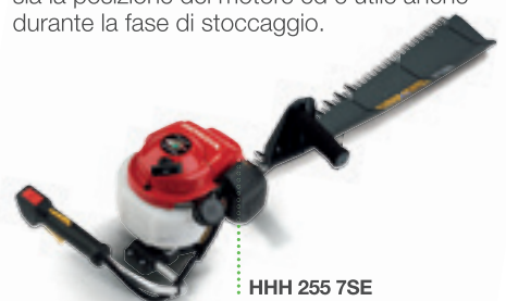
HHH 255 7SE

Il flusso d'aria può raggiungere i 600 m 3 /h consentendo di soffiare via anche i detriti più pesanti ed umidi. Il sistema cruise control permette di mantenere il regime del motore costante senza dover tenere premuto il grilletto ed è comodo per un utilizzo prolungato nel tempo. Il compatto motore Honda è stato progettato per funzionare in modo fluido con pochissime vibrazioni e bassa rumorosità ed il sistema di decompressione meccanica rende l'avviamento estremamente facile. Il sistema di lubrificazione a pompa rotante è in grado di assicurare la corretta lubrificazione qualunque sia la posizione del motore ed è utile anche durante la fase di stoccaggio.