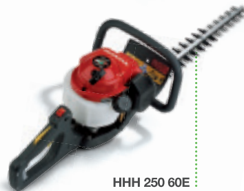
HHH 250 60 E

Il soffiatore Honda, compatto e leggero, è la soluzione ideale per mantenere giardini, parchi, strade e stadi puliti e in ordine durante tutto l'anno.