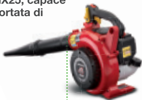
HHB 25 E

Il tagliaiepi e il soffiatore della nostra gamma portatile hanno entrambi il vantaggio di poter contare sull'insuperabile motore Honda GX25, capace di rendere alla portata di tutti tanti lavori di giardinaggio.