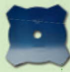
Lama a 4 punte***