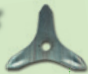
Lama a 3 punte