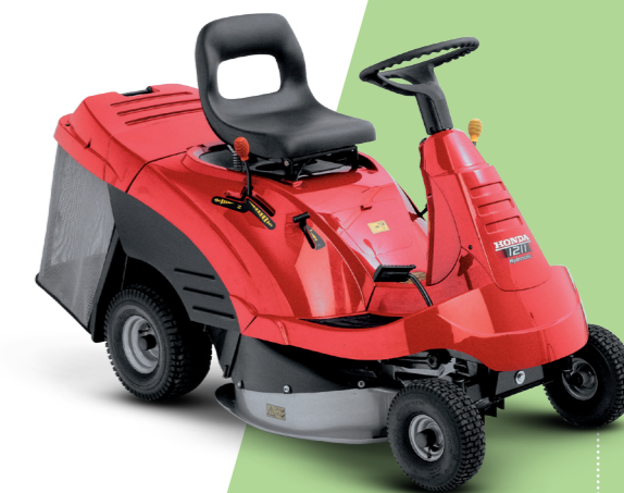
HF 1211 HE

Alimentati dai nostri motori "Pro", dotati di canna dei cilindri in ghisa e cuscinetti sull'albero motore per un funzionamento regolare e una maggiore durata del motore, sono facili da gestire grazie ad un unico pedale per il controllo della velocità di avanzamento. Sono inoltre altamente maneggevoli, con un raggio di sterzata stretto e un'eccellente visibilità così da rendere il taglio semplice e piacevole anche in presenza di ostacoli. Per risparmiare tempo e fatica durante il lavoro, è possibile vuotare il cesto raccogliherba pur rimanendo al posto di guida tramite l'azionamento di una sola leva facilmente raggiungibile.